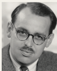
Jørgen Haagen Schmith (1910-1944) Første aktion var mod sin arbejdsplads Citroën i Sydhavnen, hvilket gav ham dæknavnet "Citronen".

Det startede med simple drillerier af værnemagten, udviklede sig til trykning og distribution af det illegale blad "De Frie Danske", og videre til store sabotageaktioner mod de tyske besættelsestropper. Jørgen "Citronen" Haagen Schmith kom i butikken bl.a. i forbindelse med planlægningen af den store sabotage mod Forum på Frederiksberg, som Værnemagten havde beslagnet til indkvartering af deres tropper. En sabotageaktion, der blev central i udviklingen af den opstand, der førte til Samarbejdsregeringens fald den 29. august 1943. Herefter måtte den første generation af Holger Danske flygte til Sverige, men andre stod klar til at videreføre arbejdet - en ny generation af Holger Danske gik ind i kampen mod de tyske besættelsestropper og deres danske håndlangere. Holger Danske var med hele vejen frem til 5. maj 1945.